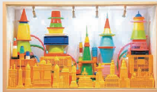
② JRタワー ART BOX 出品作品【参考作品】